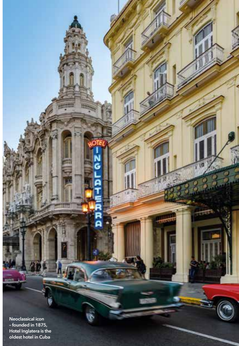
Neoclassical icon - founded in 1875, Hotel Inglaterra is the oldest hotel in Cuba

Before the pandemic Habana Light secured finance from businesses commissioning new neon signs. These included the San Rafael Boulevard sign that heralds the central pedestrian walkway lined with shops and cafés of the same name in downtown Havana, and the sign advertising the Castillo de Jagua restaurant on a broad avenue in leafy El Vedado. Sponsorship from individuals, lovers of neon, is also sought: the gloriously calligraphic blue neon Fin de Siglo (End of the Century) sign on the apartment store of the same name in Galiano Street, Havana's main shopping street in the 1950s, was one. Next up is the Aguila de Oro (Golden Eagle) sign with its Chinese script, currently hidden under the sign above the Galería Continua in Chinatown. López and Nodal are in the process of securing permission